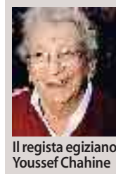
Il regista egiziano Youssef Chahine

scorso settembre alla Mostra di Venezia. Il primo riconoscimento internazionale della sua carriera gli venne però dal Festival di Berlino , quando nel '78 vinse l'Orso d'argento con Alessandria... perché? , primo capitolo di una trilogia di nuovo fortemente autobiografica che avrebbe sviluppato nel 1982 e poi nel '90 concludendola idealmente con un quarto episodio datato 2004: Alessandria, New York . Nessun genere cinematografico gli è rimasto estraneo, dalla commedia al racconto sociale, dal musical all'affresco storico di cui resta esemplare il suo Adieu Bonaparte del 1985, sulla spedizione in Egitto di Napoleone. Ma è senz'altro nel racconto intimista con valenze socio-politiche che ottenne i migliori risultati come ne Il passero del '73, data storica per il cinema egiziano poiché coincide con la prima grande co-produzione di quel paese, realizzata con l'Algeria.