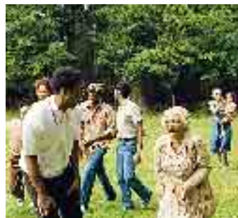
La scena del film "American gangster"

PIACENZA - (ans.) Un criminale e un poliziotto che si fronteggiano nella New York post 1968. Entrambi costituiscono un'eccezione alla regola per i gruppi di cui fanno parte. Il criminale è riuscito a farsi largo nel mercato della droga, nonostante il colore scuro della sua pelle e il dominio fino allora incontestato di altre mafie. Il poliziotto sembra l'unico integerrimo tra colleghi spesso disposti a chiudere un occhio per tornaconti personali. Rielaborando liberamente la storia vera di Frank Lucas, il regista Ridley Scott nel suo American gangster - che sarà proiettato questa sera alle 21.30 all'arena