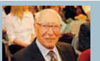
"Ars pulcherrima" al Ridotto

Un'esibizione fuori dal comune, che includeva anche "L'aube enchantée" di Ravi Shankar